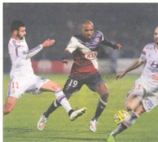
Au-delà de la sévérité du score, cette défaite est une mauvaise nouvelle pour Bordeaux dans la course à l'Europe.