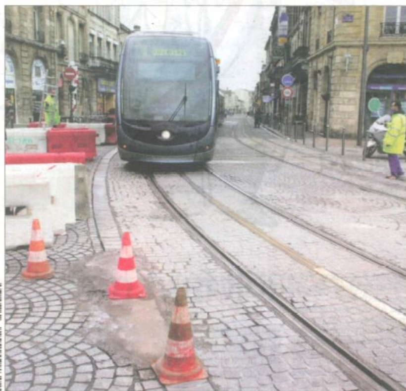
Des fonctionnaires auraient participé au trucage des marchés du tram de Bordeaux.

COLLECTIVITÉS LOCALES Selon des experts, les tentatives de corruption ont atteint un niveau historiquement haut. Le Service central de prévention de la corruption préconise un durcissement des sanctions. Pages 2 et 3